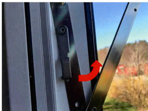
"Extra" putsbeslag i ej spärrat läge.

OBS! Vissa fönster går inte att vrida så mycket som 180 grader, då fönstrets nederkant stoppas när den kommer upp mot överkanten. (Detta beror på att fönstrens placering varierar i förhållande till fasaden). Fönstret kan då inte låsas fast i ordinarie putsläge. Om ett sådant fönster inte går att putsa från utsidan, finns en extra spärr i kanten av fönstret. Du spärrar fönstret i putsläge genom att trycka upp putsbeslaget och sätta fast det i vridbeslaget. Se bilder nedan.